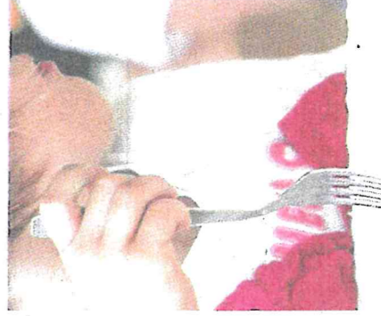
La hausse de 1 % des repas de la cantine sera applicable au 1 er septembre. ILLUSTRATION « R.P. »